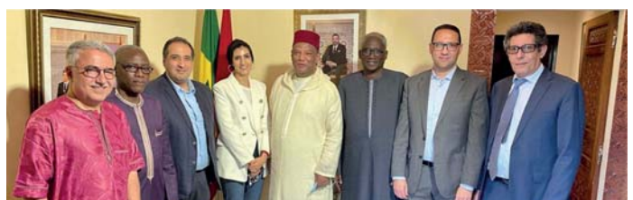
Déjeuner en la résidence de SE de l'Ambassadeur du Maroc au Sénégal

Dans un cadre très détendu, la FESELEC a offert un dîner de gala animé par le ballet national de Dakar et tous ont régalé du Thiébou dieune, le met sénégalais inscrit par l'UNESCO au patrimoine culturel immatériel de l'humanité.