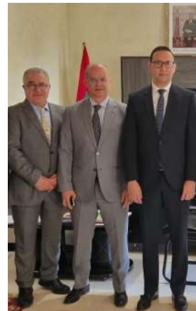
Avec SEM l'Ambassadeur