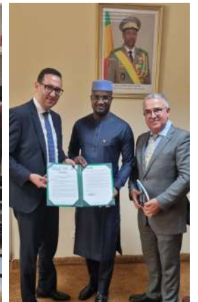
Avec SEM le Ministre